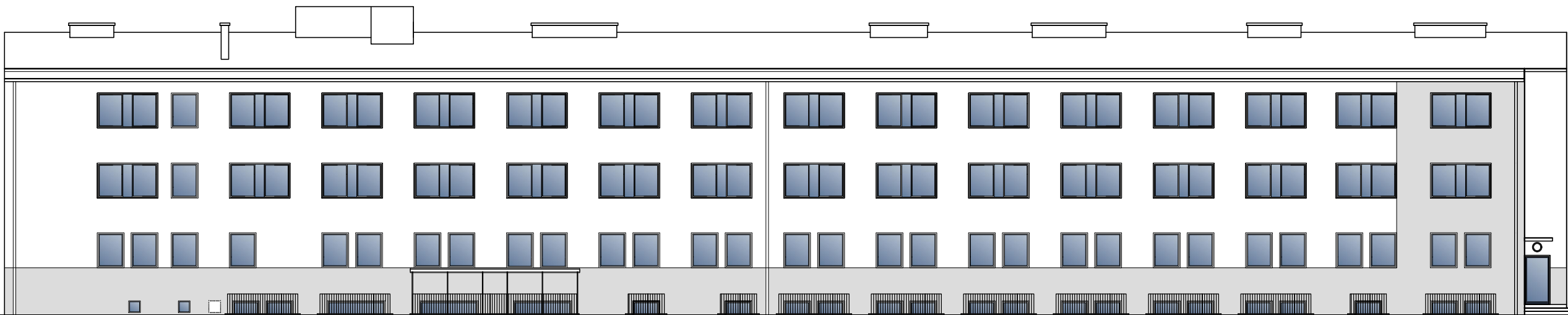
ELEWACJA ZACHODNIA 1:200